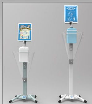
キッズ用(H683) 一般用(H903) ※本体のみの高さ

●ポンプに触れないから衛生的。●片手が塞がっていても噴射できる。●設置、交換も簡単で様々なポンプに対応。